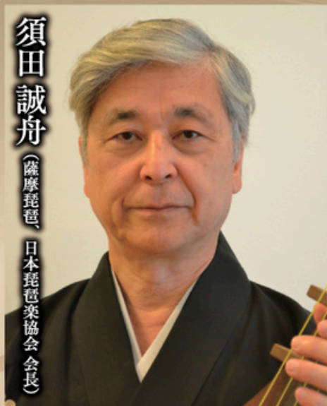
須田誠舟 (薩摩琵琶、日本琵琶楽協会会長)