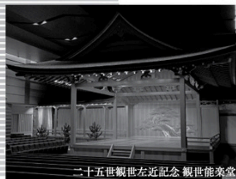
二十五世観世左近記念 観世能楽堂

第1回オーストラリア国際フルートコンクール第3位入賞。大阪フィルハーモニー交響楽団フルート奏者として活動後、日本の横笛にて現代曲アンサンブルに所属し多くの現代作品に携わる。CDアルバム「Flutist from the East」Vol.1~4、著書として「邦楽おもしろ雑学事典」「歌舞伎音楽を知る」「和楽器の世界」を出版。平成25年度より学術振興会、科学研究費助成を受け「マレーシア、ミャンマーにおける少数民族の横笛」の調査研究、27年米国 ACC基金を授与し「台湾、少数民族の音楽研究」に赴いている。